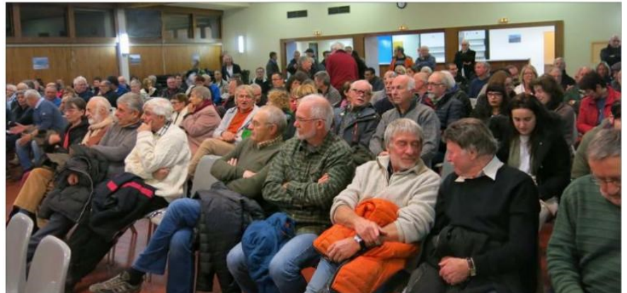
Mobilisés depuis des semaines, les élus de toute la Matheysine sont venus en nombre à la réunion, tout comme la population. Avec les salariés de la Poste, ils sont prêts à se battre pour obtenir un service public de qualité.